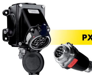
PXN12c P. 233