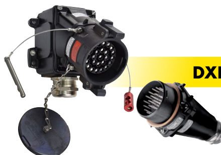
DXN25c P. 235