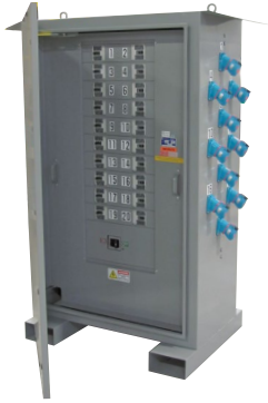
Ensamblajes con Transformadores Integrados