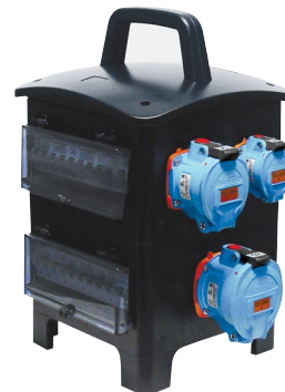
Envoltorio con Aislamiento de Caucho