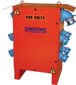
Distribución con Montaje Vertical