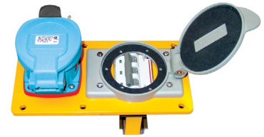
Ensamble en Placa Con Interruptor