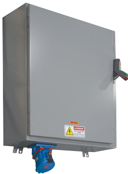
Tablero para Montaje en Pared