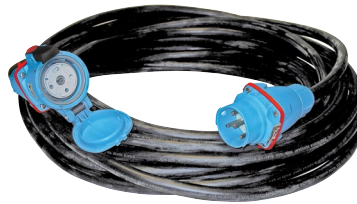
Extensiones de Cable